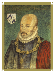
FONDAZIONE CULTURALE MICHEL DE MONTAIGNE BAGNI DI LUCCA