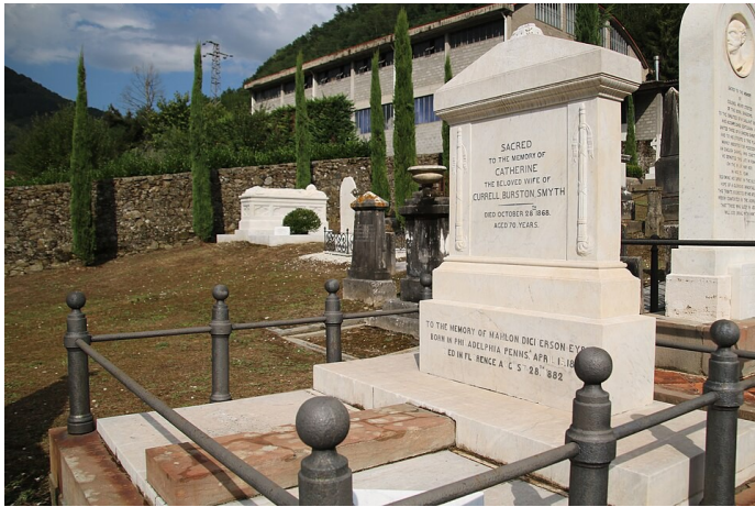
La tomba nel cimitero inglese di Bagni di Lucca