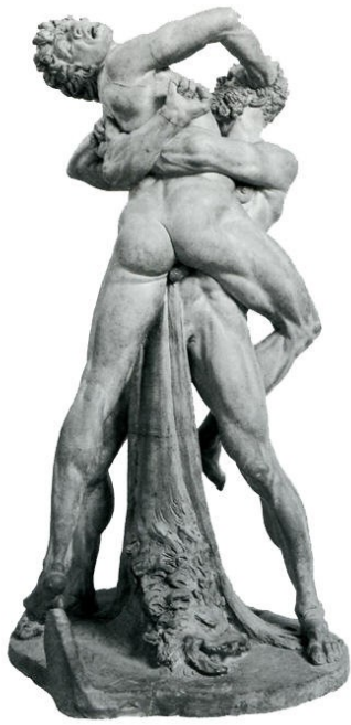
Ercole e Anteo, copia da Stefano Maderno sec. XVII