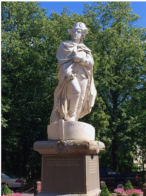
La statua di George Washington